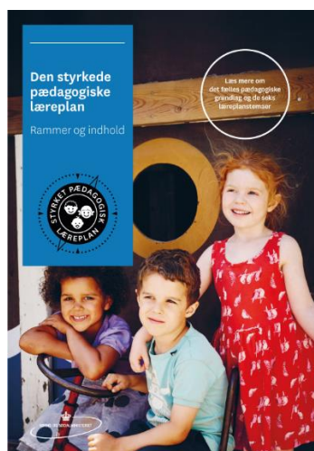
Den styrkede pædagogiske læreplan, Rammer og indhold

Inden for de krav, der følger af dagtilbudsloven, er det op til jer at beslutte, hvordan I konkret vil arbejde med den pædagogiske læreplan. Jeres læreplan skal være et dynamisk og meningsfuldt dokument, som peger fremad, og som I kan bruge aktivt i den løbende udvikling af den pædagogiske kvalitet og jeres pædagogiske praksis.